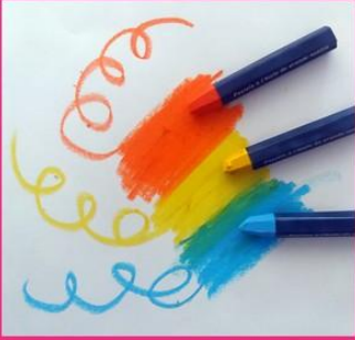
Les pastels gras