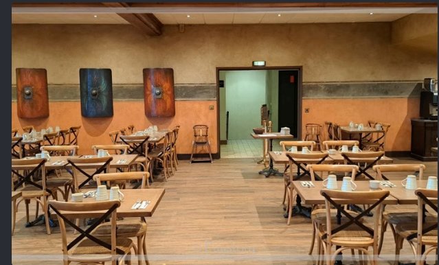
Salle à Manger d'Hiver

Support décoratif pour plusieurs lampes, ajoutant une touche d'élégance