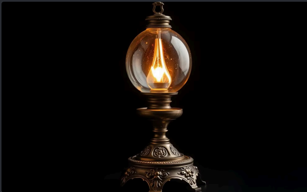
Lampe à Huile

Cette atmosphère tamisée renforçait le sentiment de confort et d'intimité pendant les longues soirées d'hiver, transformant la maison en un havre chaleureux contre les rigueurs du climat extérieur.