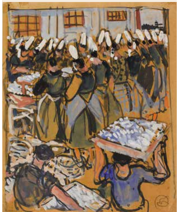
■ Conserverie en pays bigouden, Mathurin Méheut, dessin. Seconde moitié du XX e siècle.

www.collections.musee-bretagne.fr/ark:/83011/FLMjo273519