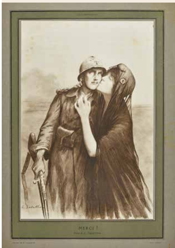
Une de l'Illustration, Merci ! Dessin de Louis-Rémy Sabattier, vers 1919.