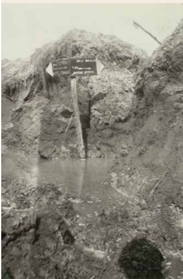
■ Pancartes de signalisation dans une tranchée

www.collections.musee-bretagne.fr/ark:/83011/FLMjo173514