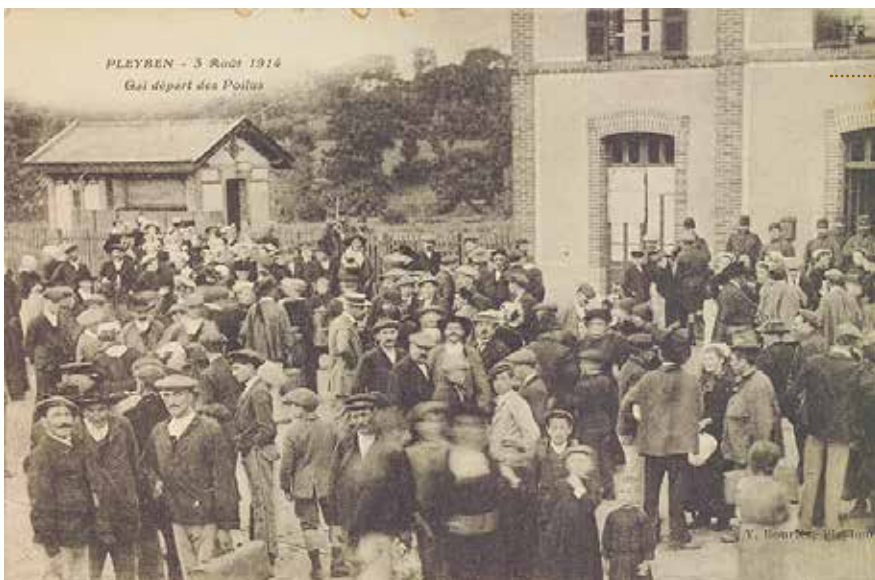
Pleyben, gai départ des poilus, 3 août 1914, carte postale, éditions Y. Bourlès

La guerre achèvera le processus d'intégration de la Bretagne et des Bretons à la France républicaine.