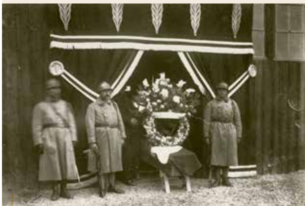
■ Réception de corps de militaires, gare de Rennes. 1914-1918.