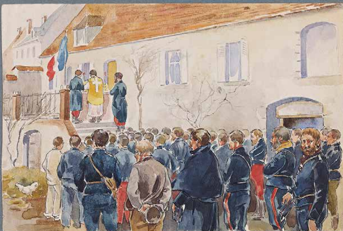
Messe de la Toussaint

Messe de la Toussaint, Charles Oberthür, ■ ..... aquarelle, 1914