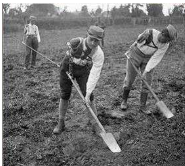
À l'Ecole nationale d'agriculture de Rennes, les mutilés de guerre réapprennent le métier d'agriculteur.

10 juin 1918.