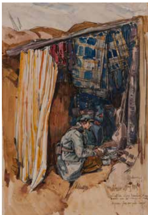
Mathurin Méheut, L'entrée d'une tranchée de luxe, dessin, 1914-1919. Musée Mathurin Méheut, Lamballe.

Comment les conditions de vie dans les tranchées peut-elle conduire à la fois à la formation d'une « communauté de tranchée » et à une déshumanisation des soldats ?