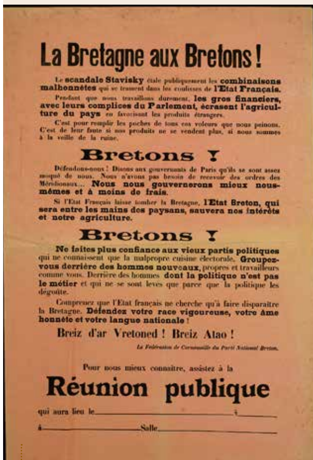
■ La Bretagne au Bretons, Affiche, Parti National Breton, 1931-1934

Cette mémoire a pu être récupérée par d'autres mouvements bretons et ce, dès la fin de la guerre. Ainsi, en 1919, renaît l'Emsav, mouvement régionaliste divers. La même année, les régionalistes indépendantistes d'extrême droite, Breiz Atao, rappellent de façon récurrente « l'impôt du sang » payé par la Bretagne à la France jusqu'à mobiliser en 1924 le chiffre de « 300 000 frères » poilus morts au combat. Ils mobiliseront de nouveau cette mémoire pour justifier, durant la Seconde Guerre mondiale, la collaboration avec l'occupant dans le but de mettre en place une Bretagne indépendante dans une Europe allemande.