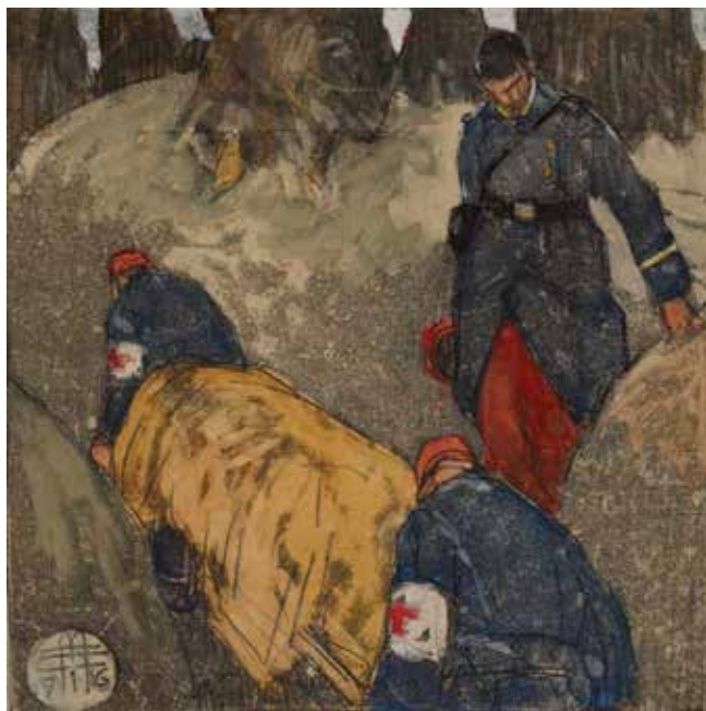
Mathurin Méheut, Les brancardiers de la Croix-Rouge, 1916 , dessin. Musée Mathurin Méheut, Lamballe.

De quelles manières l'évolution des combats a-t-elle amené à la « brutalisation » des soldats ?