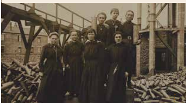
L'usine à gaz (fabrique d'obus pendant la Première Guerre Mondiale). Photographie, 1914-1918.

www.collections.musee-bretagne.fr/ark:/83011/FLMjo205716