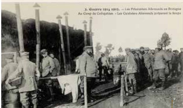
Les prisonniers allemands en Bretagne. Carte postale, Rennes. 1914-1918.

www.collections.musee-bretagne.fr/ark:/83011/FLMjo311778