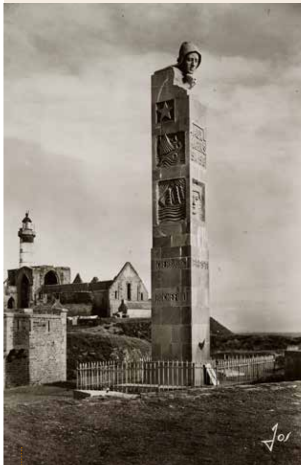
■ Plougonvelin, Pointe Saint Mathieu, Monument aux morts. Carte postale, Editions d'Art Jos Le Doaré ; Châteaulin.

Des communes ou des notables ont pu devancer la loi du 25 octobre 1919 organisant « la commémoration et la glorification des morts pour la France au cours de la Grande Guerre ». Par exemple, à Lanilis (29), c'est la femme du maire qui impulse la construction d'un monument dès 1917. Celui de Pont-Scorff a été commandé par la princesse Henri de Polignac suite à la mort de son mari, tombé en Champagne, en 1915. Celui-ci sera réalisé par l'architecte des monuments historiques Charles de Chaussepied et par le sculpteur René Quillivic qui réalisera de nombreuses œuvres dont le monument de Plougonvelin (ci-dessus) entre 1923 et 1927.