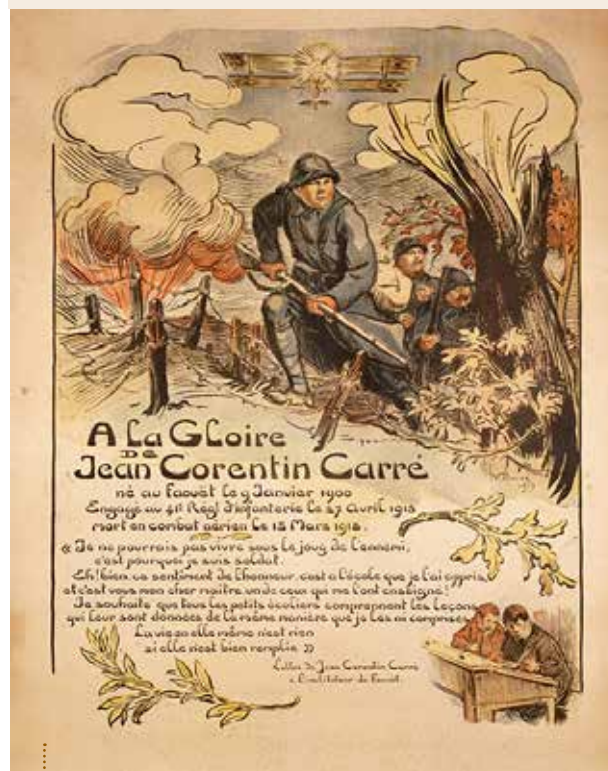
■ Affiche à la gloire de Jean-Corentin Carré, commandée au dessinateur Victor Prouvé, 1919

Au sein de ces mémoires, l'héroïsation des Bretons est mise en avant notamment par l'intermédiaire de la