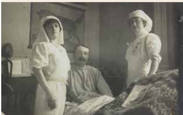
Guerre 1914-1918. Carte postale où deux aides soignantes posent au chevet d'un soldat convalescent. Anonyme.

www.collections.musee-bretagne.fr/ark:/83011/FLMjo150347