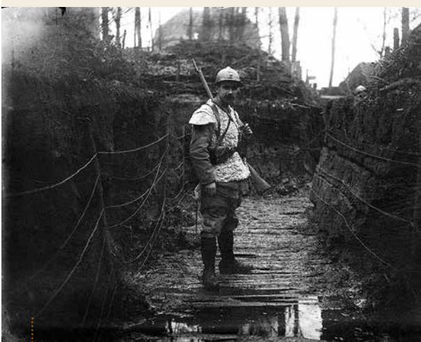
■ Amédée Fleury, au front, 1915, Belgique. Négatif / verre

www.collections.musee-bretagne.fr/ark:/83011/FLMjo276220