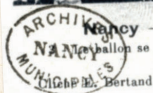
Nancy — L'Accident du Ballon (14 Juillet 1908) Le ballon se dégonfle. - Les pompiers arrivent avec l'échelle Gugumus