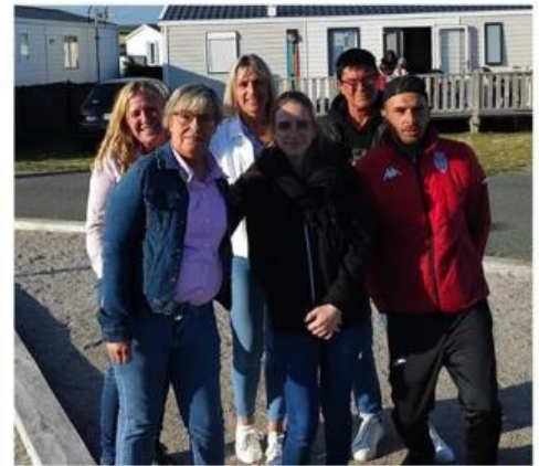
L'équipe du camping est prête!