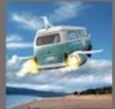
The Flying campers

Un petit concert bien sympa avant le traditionnel feux d'artifice